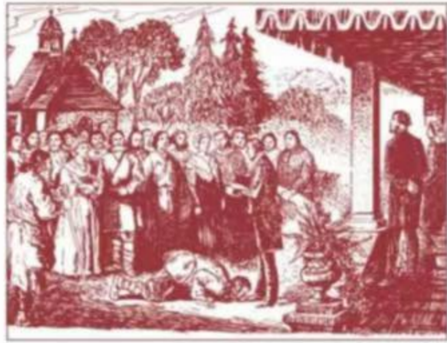
贵族宣读“解放”农奴的法令