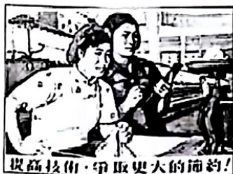
图 1 (提高技术 争取更大的节约)