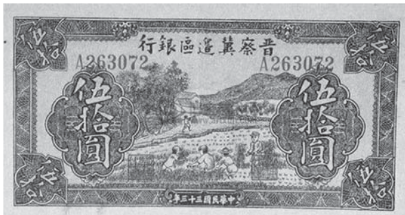
图1 为晋察冀边区银行发行的抗日票。这是敌后抗日根据地唯一一家经当时国民政府批准设立的银行，1938年正式成立，起到了稳定边区物价和支持敌后抗战的作用。

史料教学设计中常把多种史学研究方法融入试题之中，考查学生综合分析能力，下面是以抗战时期货币金融史材料设计的基于史学研究方法的教学案例：