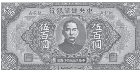
图2 为中央储备银行发行的中储券。该银行1941年在南京成立，作为国家银行发行本位币，可与法币（官方统一货币）互相兑换，在华东、华中和华南地区曾大量流通。