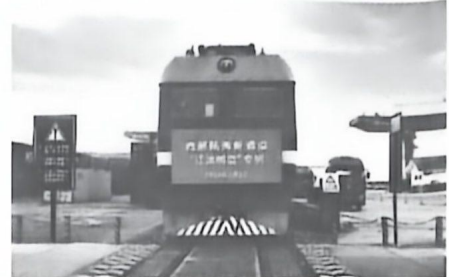
素材3 西部陆海新通道班列

1992年,我国相继开放了重庆、武汉等沿江城市。2019年,国家西部陆海新通道战略深化陆海双向开放。截至2025年底,以重庆为运营组织中心的西部陆海新通道,已辐射全球127个国家和地区的584个港口。