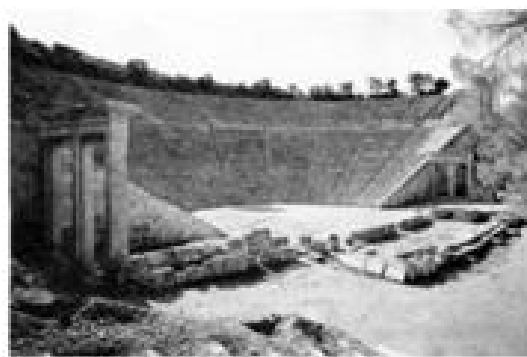
古希腊埃皮达鲁斯剧场

材料二 中国古代戏曲起源于祈获丰收和狩猎胜利的原始宗教歌舞。明清是中国古代戏曲的繁荣时期，这时的戏曲多为反映忠孝节义的美德故事，扎根人民生活，并形成了多样的剧种和流派。古希腊戏剧起源于群众性的节日歌舞和祭祀活动，有悲剧和喜剧两种形式。悲剧主要取材于神话传说和英雄史诗，寄寓了剧作家的政治主张；喜剧取材于日常生活，多为政治和社会讽刺剧。观看戏剧是古希腊公民政治生活的重要内容。↵