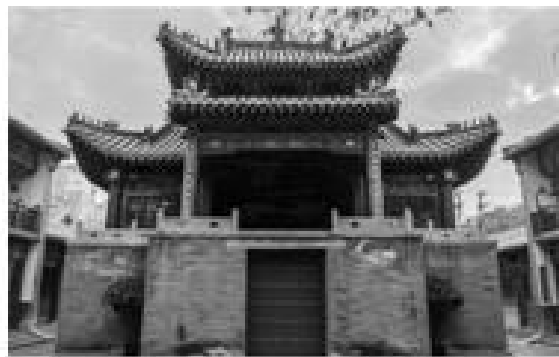
郑州城隍庙古戏楼