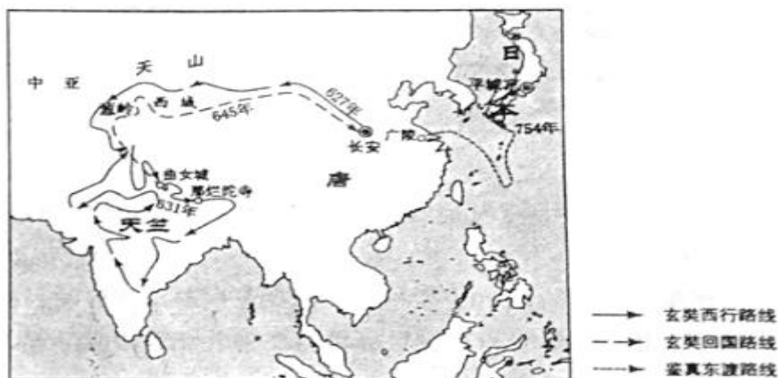
图6 玄奘西行与鉴真东渡路线示意图

玄奘(602~664),为寻求准确的佛经文本,西行“求法”,历经艰辛,十余年中,行程数万里,游历百余国。回国后,他译出佛经1300多卷,精炼而准确。由他口授而成的《大唐西域记》一书,是研究中外文化交流的重要典籍。